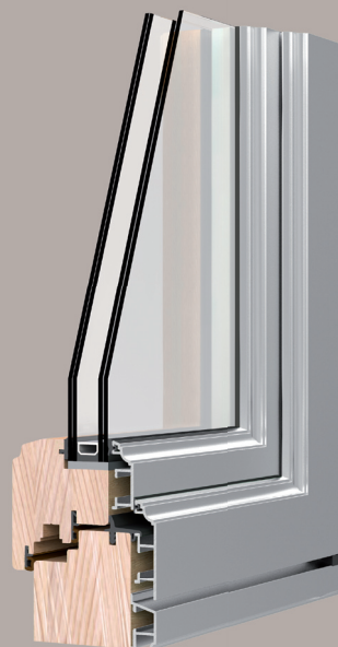
Sistema Alluminio Impero design antico e geometrie del passato.

Il sistema Alluminio Impero è l'espressione di design di "altri tempi". Si contestualizza perfettamente negli edifici fortemente caratterizzati dalle linee architettoniche del passato, rispettando le geometrie ed il fasto dei serramenti antichi. La gamma dei profili è molto ampia ed è in grado di soddisfare ogni esigenza costruttiva.