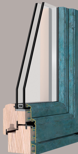
Sistema 5000/S Bronzo design antico e geometrie del passato.

Ramatura: Il trattamento di ramatura, eseguito dopo la saldatura dei telai mediante applicazione di uno speciale prodotto sulla superficie del profilo, reagisce sulla parte in rame della lega producendone l'effetto di invecchiamento veridicamente tipico delle statue esposte per lungo tempo all'esterno o dei tetti in rame dei monumenti storici.